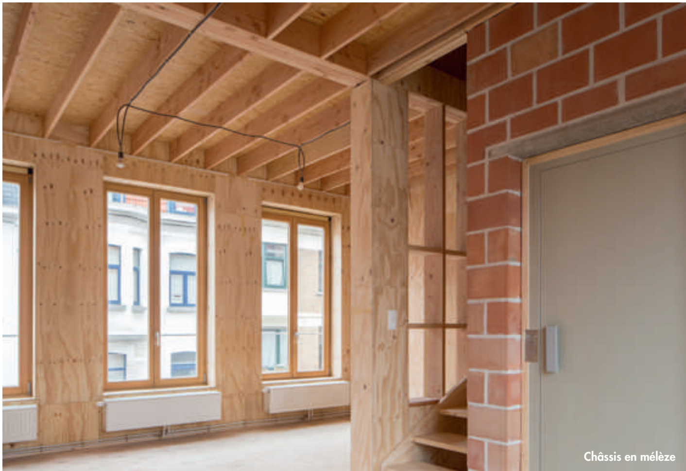
Châssis en mélèze