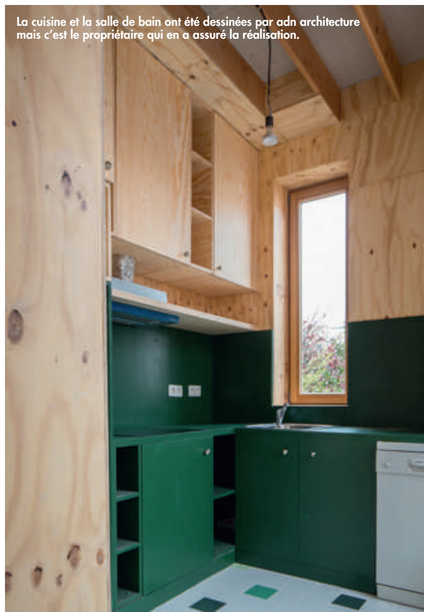
La cuisine et la salle de bain ont été dessinées par adn architecture mais c'est le propriétaire qui en a assuré la réalisation.

L'escalier fait écho à la logique « structuraliste » du projet. Les gîtes redescendent verticalement, pour former le garde-corps et une étagère. Si le résultat formel n'était pas prédéterminé, tributaire de la logique constructive, les architectes n'en ont pas moins pris soin d'harmoniser l'ensemble en limitant le nombre de matériaux. Aux panneaux de multiplex de sapin et au gîtage de bois brut, s'associe une partie en maçonnerie de blocs de terre cuite qui circonscrit la cage d'ascenseur. Elle amène également une certaine inertie dans le projet. De l'extérieur, le langage formel de la maison révèle également de nombreuses subtilités. En effet, l'appareillage de la brique alterne dispositions verticale et horizontale, dans une tradition bruxelloise que l'on peut observer dans diverses façades de la capitale. La distribution irrégulière des fenêtres joue également avec la perception du passant.