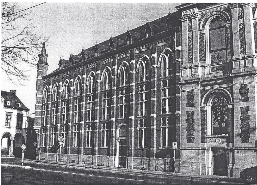
► Façade néogothique de l'orphelinat à Boussu-Centre.

L'immeuble offre une perspective unique sur la place arborée de Boussu, au demeurant répertoriée comme patrimoine architectural de Belgique. Et tout est à deux pas : l'administration