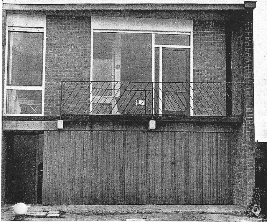
Façade vers la voie publique.