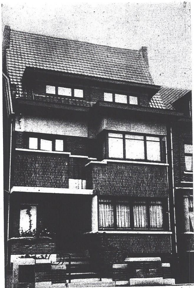
Villa à Wavre. Arch. J. et V. Hottat. Façade en briques Dieren vieil or.

Et lorsque vous reviendrez de vos vacances, visitez, à Bruxelles, 1-5, quai des Usines, les nouveaux dépôts de Kessels, agent général des Briqueteries de Dieren et de Venloo. Ce technicien vous montrera, dans sa salle d'Exposition et ses dépôts, 135 sortes de briques de format, colorations et grains différents : une richesse pour la décoration rationnelle des nouveaux logis.