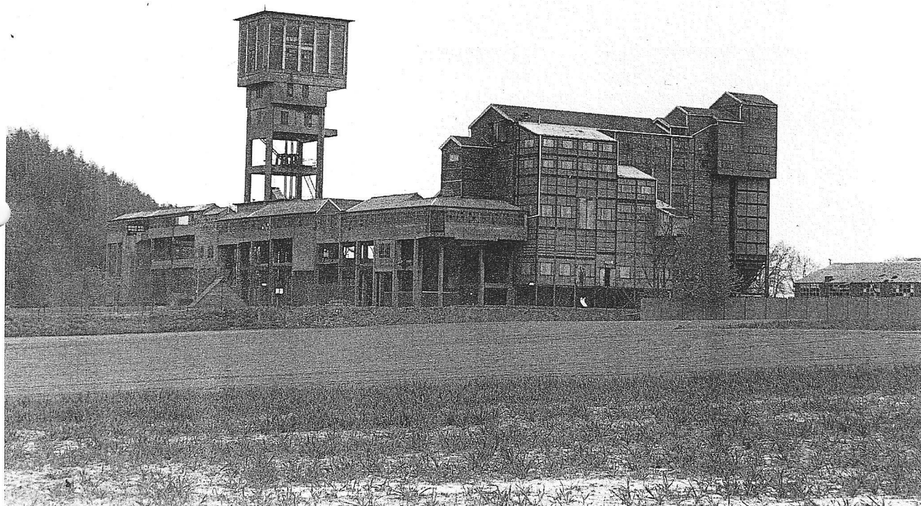
En avant-plan, le puits « Marie ». Derrière, le puits n° 1.