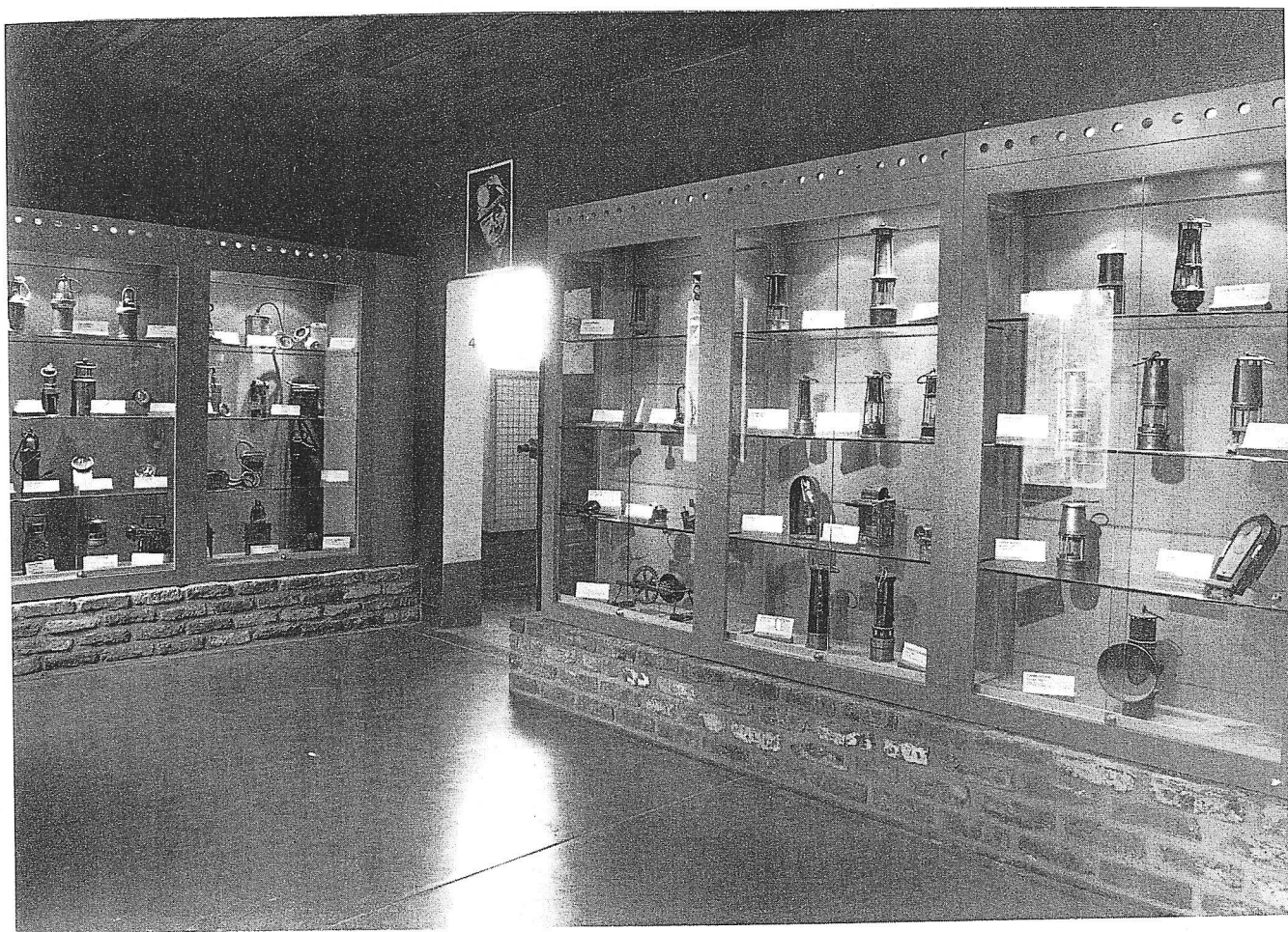
Un musée pour conserver la mémoire de l'industrie minière. Vue d'une salle consacrée à la lampisterie.