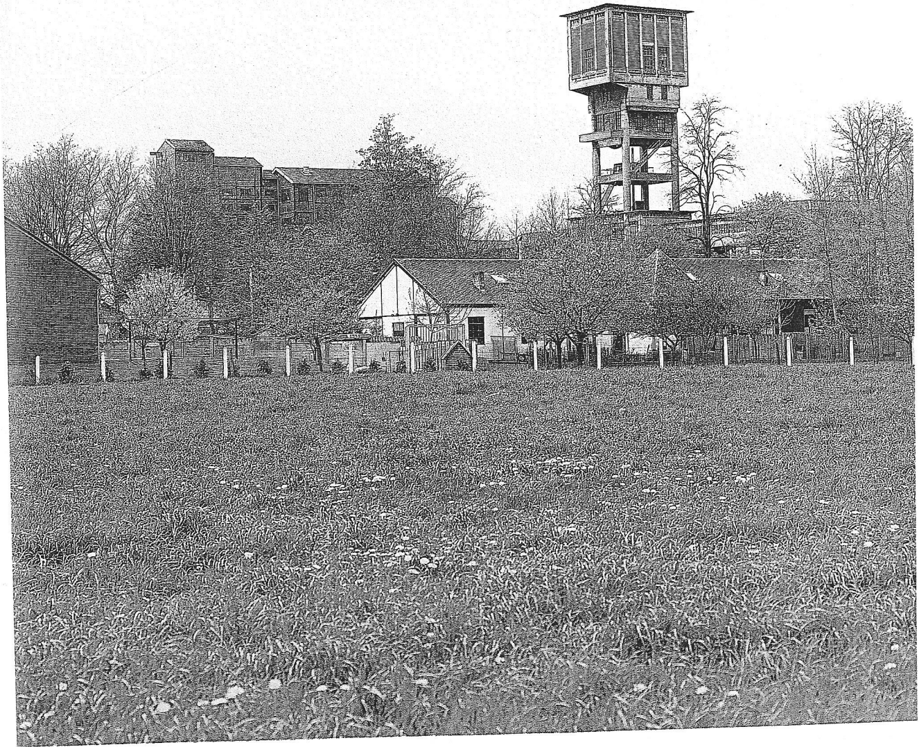
Un site industriel d'une qualité exceptionnelle.